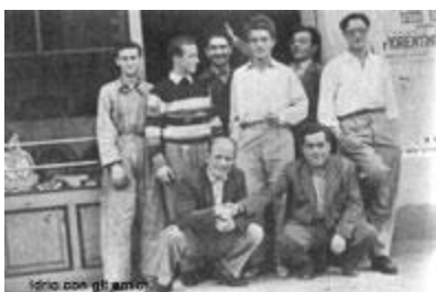
Idrio con gli amici