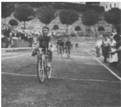
A Siena al Rastrello. G.P. Pibigan

1955 Dilettante con la soc. Porta Romana 7 vittorie