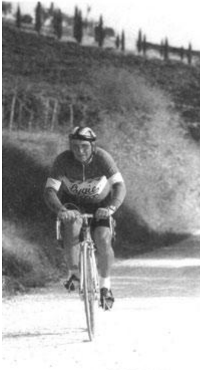
Da: all' "Erreca" e Galele nel 2004